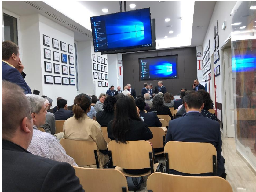
Jednání Global CE Summit

inženýrů do rozhodovacích procesů ve zdravotnictví; podpora vzdělávání v oblasti klinického inženýrství; bezpečnost používání zdravotnických prostředků; mezinárodní spolupráce a další.